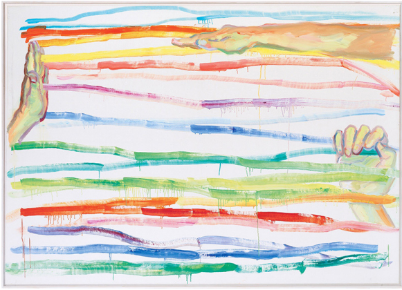
Maria Lassnig. Hände. 1989 Verkauft für 550.000 EUR (inkl. Aufgeld)