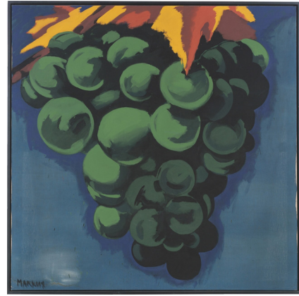
Markus Lüpertz. Weintraube. 1971 Verkauft für 325.000 EUR (inkl. Aufgeld)