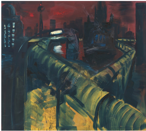
Rainer Fetting. „Mauer am Südstern“. 1988 Verkauft für 168.750 EUR (inkl. Aufgeld)