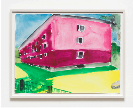
Tamina Amadyar. fünfte straÙe. 2021 Watercolor on paper. 36 x 48 cm