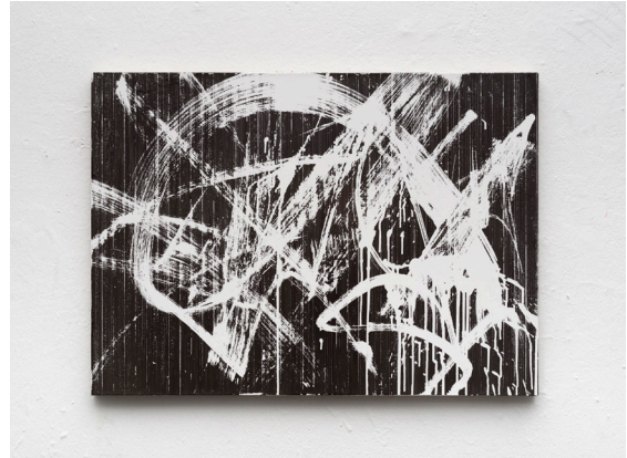
Gregor Hildebrandt. Horses in my Dreams (PJ Harvey). 2021 Magnetic audiotape coating, adhesive tape, acrylic on canvas. 59 x 81,5 cm. Song on the tape: Horses in my Dreams, by PJ Harvey