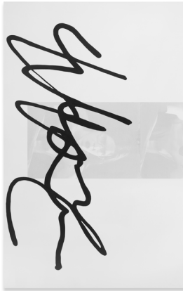
Eliza Douglas & Anne Imhof. Untitled. 2017 Silkscreen on oil on canvas. 300 x 190 x 2.5 cm