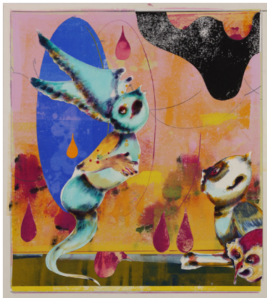
Gert & Uwe Tobias. Ohne Titel / untitled. 2022 Collage on cardboard. 56 x 50 cm