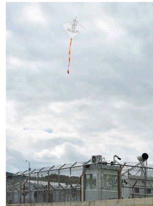
Raul Walch. Azimut Moria ( Series: It Is A Great Pressure To Be Here) 2016. Inkjet Fine Art Print on Hahnemühle PhotoRag Ultrasmooth 305 gr. 40 x 30 cm