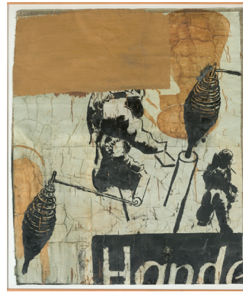
Neo Rauch. Hände. 1993 Öl und Shellac auf Papier, collagiert, auf Leinwand. 145,5 × 123 cm EUR 100.000–150.000