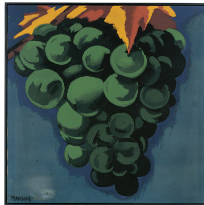
Markus Lüpertz. Weintraube. 1971 Leimfarbe auf Leinwand. 200 × 200,5 cm. EUR 100.000–150.000