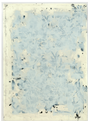
Christopher Wool. Ohne Titel (D 64). 1998 Alkyd auf Reispapier. 167 × 120 cm. EUR 300.000–400.000