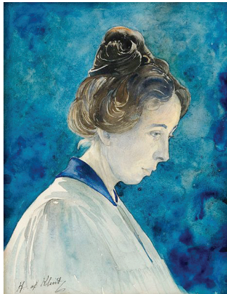
Hilma af Klint. „Selbstportrait“. Undatiert. Aquarell auf Papier. Ca. 27,5 x 21,5 cm.