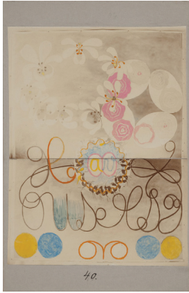
Hilma af Klint. Studien für „Gemälde für den Tempel“. Undatiert. Kolorierte Photographie auf Pappe. 10 x 15 cm. Copyright Stiftelsen Hilma af Klints Verk