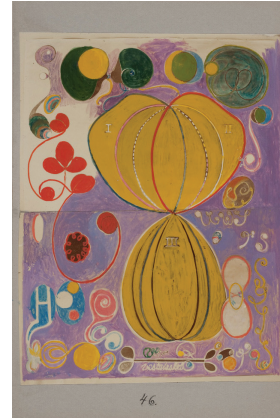
Hilma af Klint. Studien für „Gemälde für den Tempel“. Undatiert. Kolorierte Photographie auf Pappe. 10 x 15 cm.